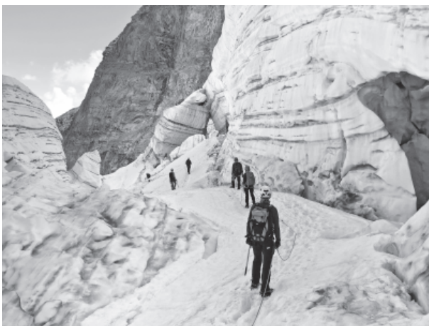
Schwindendes Eis am Piz Palü. Der Abstieg führte diesen Sommer mitten durch die Spaltenzone.