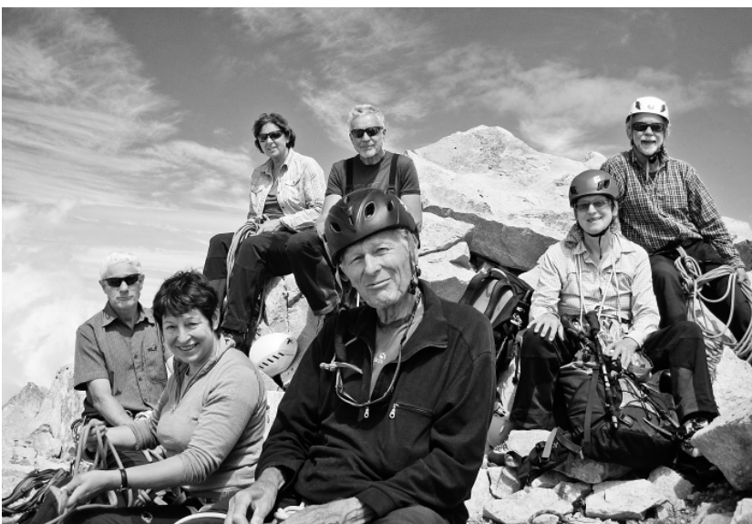
Die Senioren sonnen sich auf dem Piz Casnil.

Der bisherige Vorstand stellt sich zur Wiederwahl.