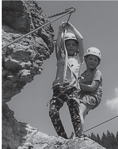
Am Crep Casti