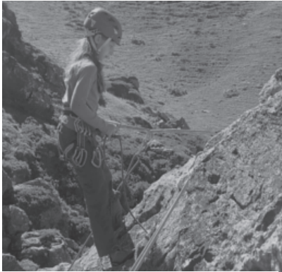
Auf der Mettmenalp