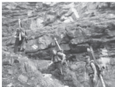
Wohin des Weges mit Skis?

Während die einen im Mai bereits mit Klettern, Wandern und Biken begannen, machten die Fans von Skihochtouren noch ihre letzten Schwünge im Sulzschnee.