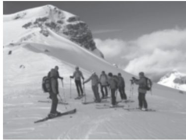
Fortbildungskurs Lawinen für Tourenleiter/-innen

Wir sind froh und dankbar, dass wir auch dieses Jahr die Saison ohne grössere Zwischenfälle zu Ende führen konnten. Die grosse Kompetenz und die gute Ausbildung der Tourenleiter /-innen, sind sicher der Hauptgrund für diese Tatsache. In Fortbildungskursen, welche teilweise von der Sektion angeboten werden, bilden sich die Tourenleiter /-innen regelmässig weiter, repetieren ihr Können und Lernen neue Methoden oder Erkenntnisse kennen und anwenden. Das Engagement der Tourenleiter /-innen ist sehr gross und sie leisten einen sehr wichtigen Teil für unsere Sektion. Umso erfreulicher ist es, dass sich immer wieder neue Mitglieder für die Tourenleiterausbildung melden.