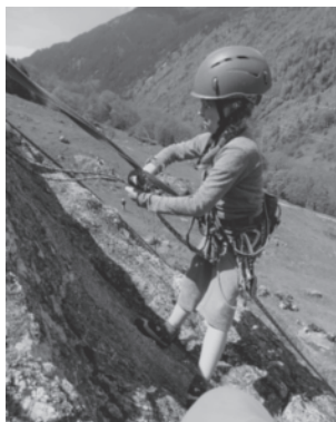
Abseilen am Aaterästei

Dank der gewissenhaften und liebevollen Betreuung durch Eltern, Begleiter und Helfer einerseits und dem motivierten und konzentrierten Engagement der Kinder andererseits, schliessen wir eine unfallfreie Klettersaison ab. Die aktive Mithilfe von Eltern und Helfern ist entscheidend für einen erfolgreichen FaBe-Betrieb. Dem Materialverwalter ein Dankeschön, für die sorgfältige Pflege und die prompte Bereitstellung des Leihmaterials. Mit attraktiven Anlässen im FaBe-Programm 2018 versuchen wir das Kletterinteresse zu wecken und Familien für den Bergsport zu begeistern. Ich freue mich auf bekannte und neue aktive Kinder und Eltern.