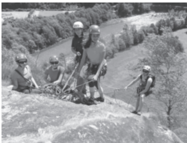
Auffahrtsklettern im Tessin

In den Sommerferien führte der Klassiker, das KiBe-Lager (Kinderbergsteigen) die Teilnehmenden auf die Sustlihütte. Zumindest war das im Jahresprogramm so zu lesen. Da die Nachfrage extrem klein war, mussten wir mit Bedauern nach sehr vielen durchgeführten Lagern das diesjährige als abgesagt aufführen.