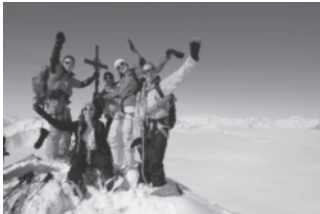
Skihochtour auf den Piz Badus

Als Auftakt von unserem Outdoorprogramm gab es einen Dreigänger an Skitouren. Um wieder in Schwung zu kommen oder einmal einen Einblick zu erhalten, starteten wir mit dem Pischahorn. Eine etwas schwerere Tour folgte einen Monat später mit dem Glatthead. Noch voll im Schuss folgte als Abschluss eine zweitägige Skihochtour auf den Piz Badus.