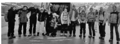
Kletterkurs Teil 2