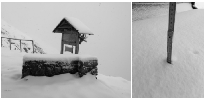
Impressionen: 14. Juli 2016

Zum Saisonbeginn konnte ein erster Augenschein mit der Steinmandli GmbH betreffend Klettersteig vorgenommen werden, die Offerte über Fr. 90'000 erhielten wir im August zugestellt.