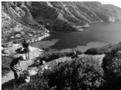
Herbstkletterlager in Cassis

Das diesjährige Herbstkletterlager führte uns nach Cassis, unweit von Marseille. Dank zwei Mietbussen konnten wir alle Bedürfnisse abdecken. Seien es 6c-Klettereien im Einseillängenbereich oder eine schöne Mehrseillängenroute in der Calanque, z.B. „Sormiou“ im 4er Bereich.