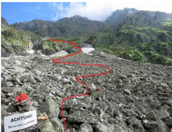
Die Wegspur führt über den neuen Schuttkegel

Einzig der Hüttenweg musste teilweise umgelegt und während der Saison mehrmals den neuen Verhältnissen angepasst werden. Alles in allem ist der Weg nun sogar sicherer geworden, da die losen Felsmassen, die uns schon länger Anlass zur Sorge gegeben hatten, zum grössten Teil abgerutscht sind.