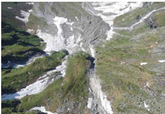
Foto vom Schuttkegel, insgesamt haben sich gegen 5000m 3 Fels gelöst

Nach diesem Augenschein mit einem Vertreter der Gemeinde und dem GR-Amt für Naturgefahren per Heli, konnte aber zu unserer Erleichterung Entwarnung und somit der Hüttenzustieg für die beginnende Sommersaison frei gegeben werden.