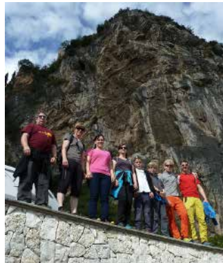
Herbstkletterlager in Arco IT

Der Startschuss für Aktivitäten am Fels fiel dieses Jahr im April mit dem Boulderwochenende im Tessin inkl. einer Nachtboulder-Session. Nebst den gewohnten Klettereien, standen der Klettersteig Braunwald und eine Gratkletterei auf den Bergseeschijen auf dem Programm.