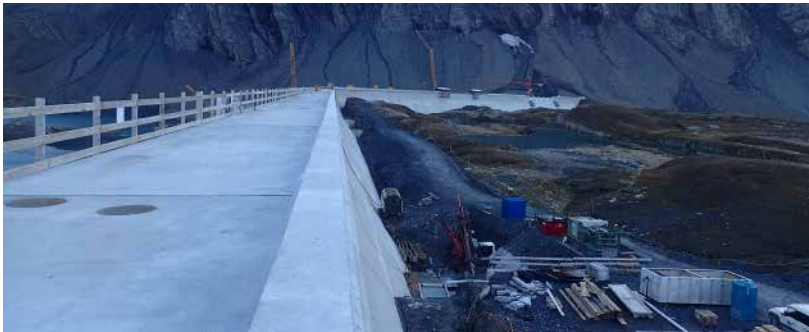
Die fertig gestellte neue Staumauer auf Muttsee ist die Längste der Schweiz.