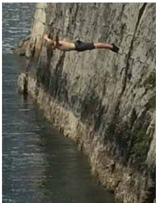
Deep Water Soloing (DWS) 1

Durch die neue Halle und das Durchschnittsalter der Jugendlichen haben wir im Kernteam zwei Veränderungen beschlossen und umgesetzt.