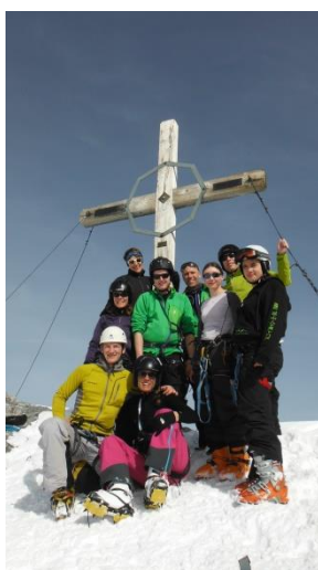
Gipfel des Clariden

Der Winter 2013/2014 war in der Schweiz der drittwärmste seit Beginn der Messungen vor 150 Jahren. Im Churer Rheintal wurde es mit häufiger Föhnunterstützung gar der wärmste Winter seit Messbeginn. Auf der Alpensüdseite fielen Niederschlagssummen in Rekordhöhe, in höheren Lagen enorme Neuschneesummen. (Meteoschweiz.ch) So schlimm war die Saison für uns aber nicht. Wer wollte, fand durchaus guten Schnee, wenngleich nicht immer dort, wo er üblicherweise anzutreffen ist. Die Jugend konnte denn auch trotzdem einige Wintertouren durchführen. Das Skitourenlager gemeinsam mit der JO Rinsberg begeisterte die Teilnehmer und sowohl die Skitour am Fisetengrat als auch die Überschreitung des Clariden konnte mit einigen Jugendlichen erfolgreich durchgeführt werden. Das Eis wollte aber partout nicht wachsen, worauf beschlossen wurde, das Eisklettern in diesem Jahr ausfallen zu lassen.