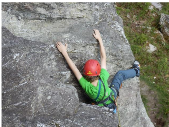
Kletterkurs Teil 1