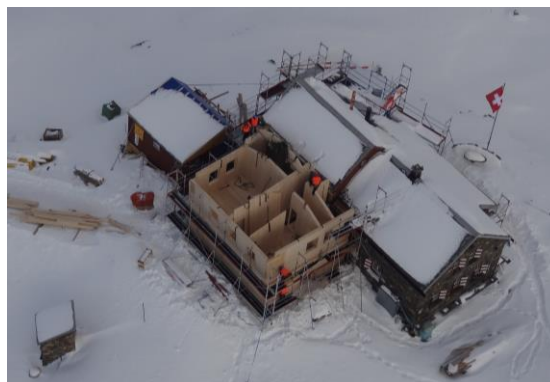
Der neue Anbau beinhaltet im Parterre den Sanitärbereich, im ersten Stock liegt der Hüttenwartzbereich mit eigenem WC. Von der Küche führt ein neues Treppenhaus in Keller und 1. Stock.